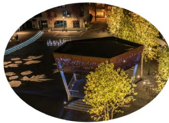
Wegwijs in Zwolle samenhang als project