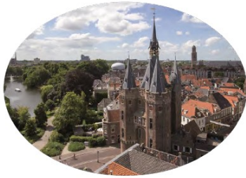
Trots op Zwolle individuele lichtobjecten