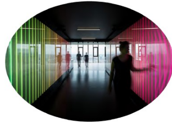
Dynamisch de toekomst tegemoet controle & innovatie